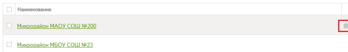
Рисунок 10 – Удаление микрорайона

Примечание: удалить можно только микрорайон, к которому не привязаны организации и адреса.