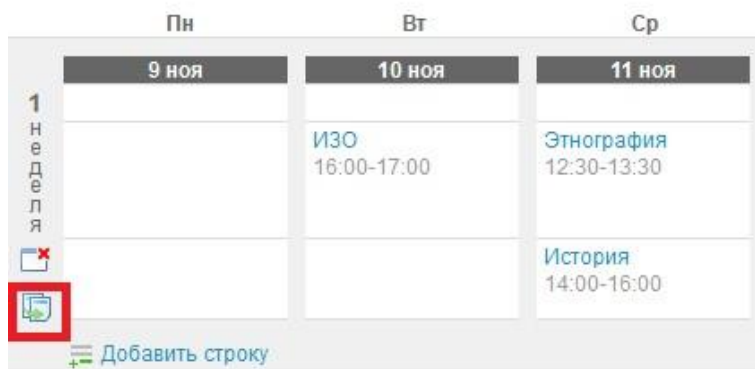
Рисунок 2 - Копирование занятий в расписании

Для редактирования данных занятия необходимо нажать на иконку «карандаш», появляющуюся при наведении курсора на это занятие. Откроется окно «Редактирование занятия». После завершения изменения данных нужно нажать на кнопку «Сохранить». Примечание: если некорректно указаны дата занятия или предмет, то занятие нужно удалить из расписания и заново внести информацию.