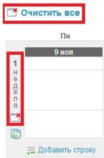
Рисунок 3 - Удаление схемы занятий в расписании